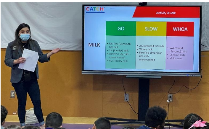
Students in Del Rio, Dimmit, and Eagle Pass learned about what kind of food they should prioritize when looking for what to eat. Estudiantes de Del Rio, Dimmit e Eagle Pass aprendieron sobre a qué tipo de alimentos darles prioridad al momento de buscar qué comer.

These metrics are related to the Supplemental Nutrition Assistance Program Education ( SNAP-Ed ). SNAP-Ed is a federally funded evidence-based grant program, intended to implement nutrition education and obesity prevention for eligible individuals.