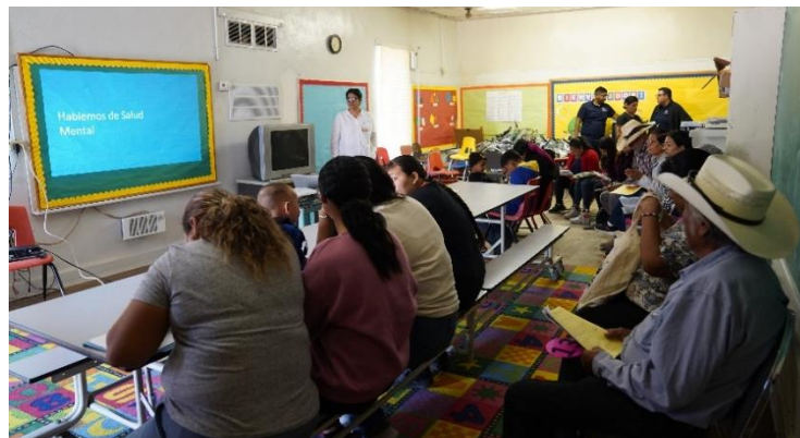
Members of the community gathered to receive education on topics like mental health. Integrantes de la comunidad se reunieron para recibir educación en temas como salud mental.