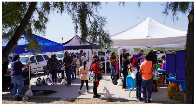
Tents included exhibitions as well as games for the children and adults. Las carpas incluyeron exhibiciones y juegos para niños y personas adultas.